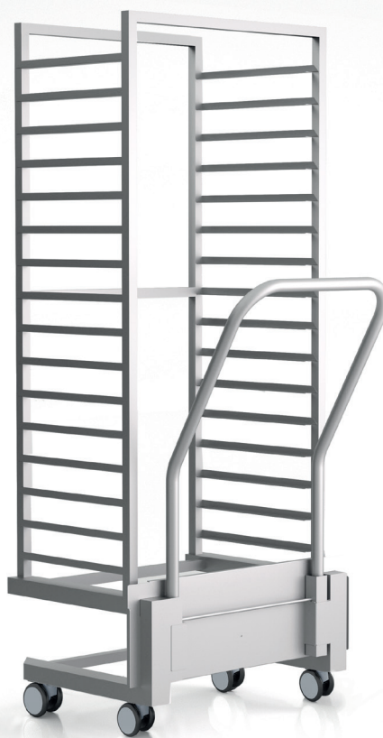
TROLLEY SERIES ST